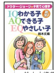
鈴木文織著 (株)第三文明社 定価：840円