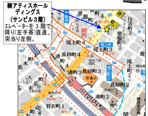
JR 関内駅 北口から徒歩 2分