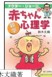
鈴木文織著 (株)第三文明社 定価：840円