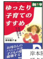
岸本隆子著 アクア出版 定価：1,575円