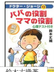
鈴木文織著 (株)第三文明社 定価：840円